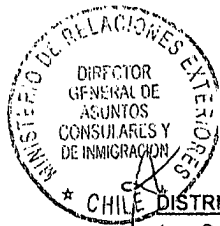
EDGARDO RIVEROS MARIN Subsecretario de Relaciones Exteriores